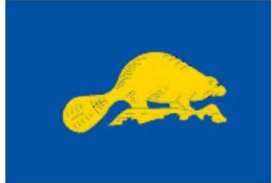
Detalle del reverso de la bandera